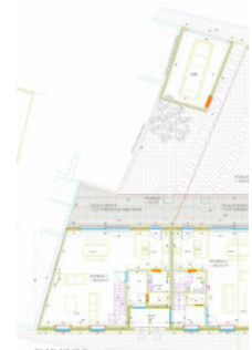
PLAN NIVO 0